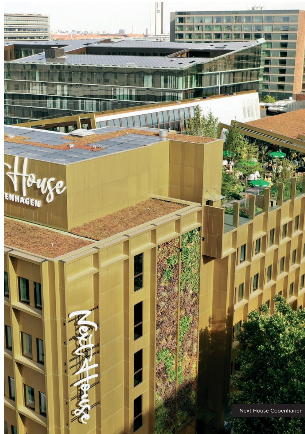
Next House Copenhagen

Next House Copenhagen afventer sin endelige DGNB-certificering.