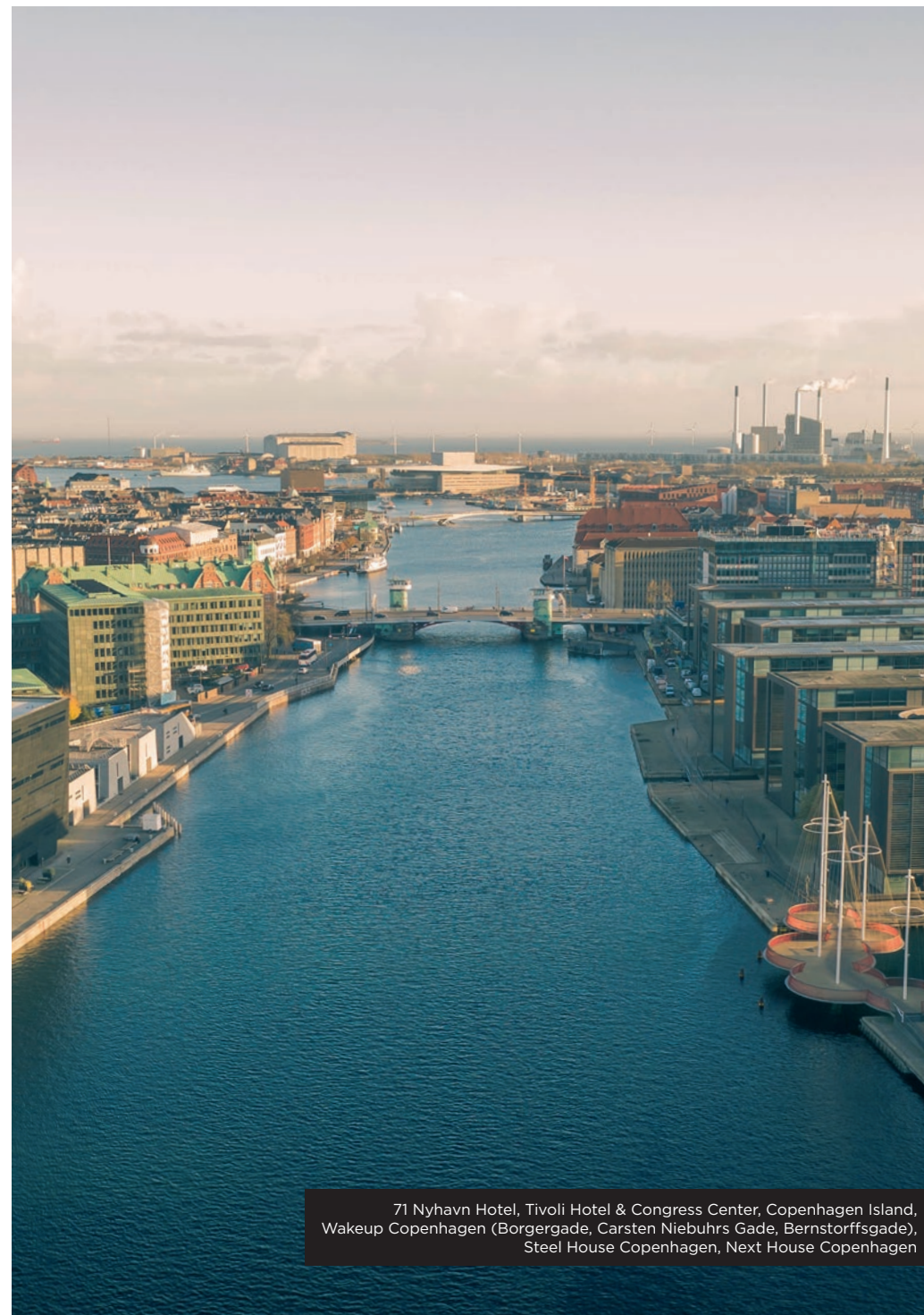
71 Nyhavn Hotel, Tivoli Hotel & Congress Center, Copenhagen Island, Wakeup Copenhagen (Borgergade, Carsten Niebuhrs Gade, Bernstorffsgade), Steel House Copenhagen, Next House Copenhagen

I samarbejde med HOFOR gennemfører vi desuden hvert år optimeringsprocesser på alle hoteller og hostels for at finde mulige energiforbedrende tiltag f.eks. i vores vandinstallationer.