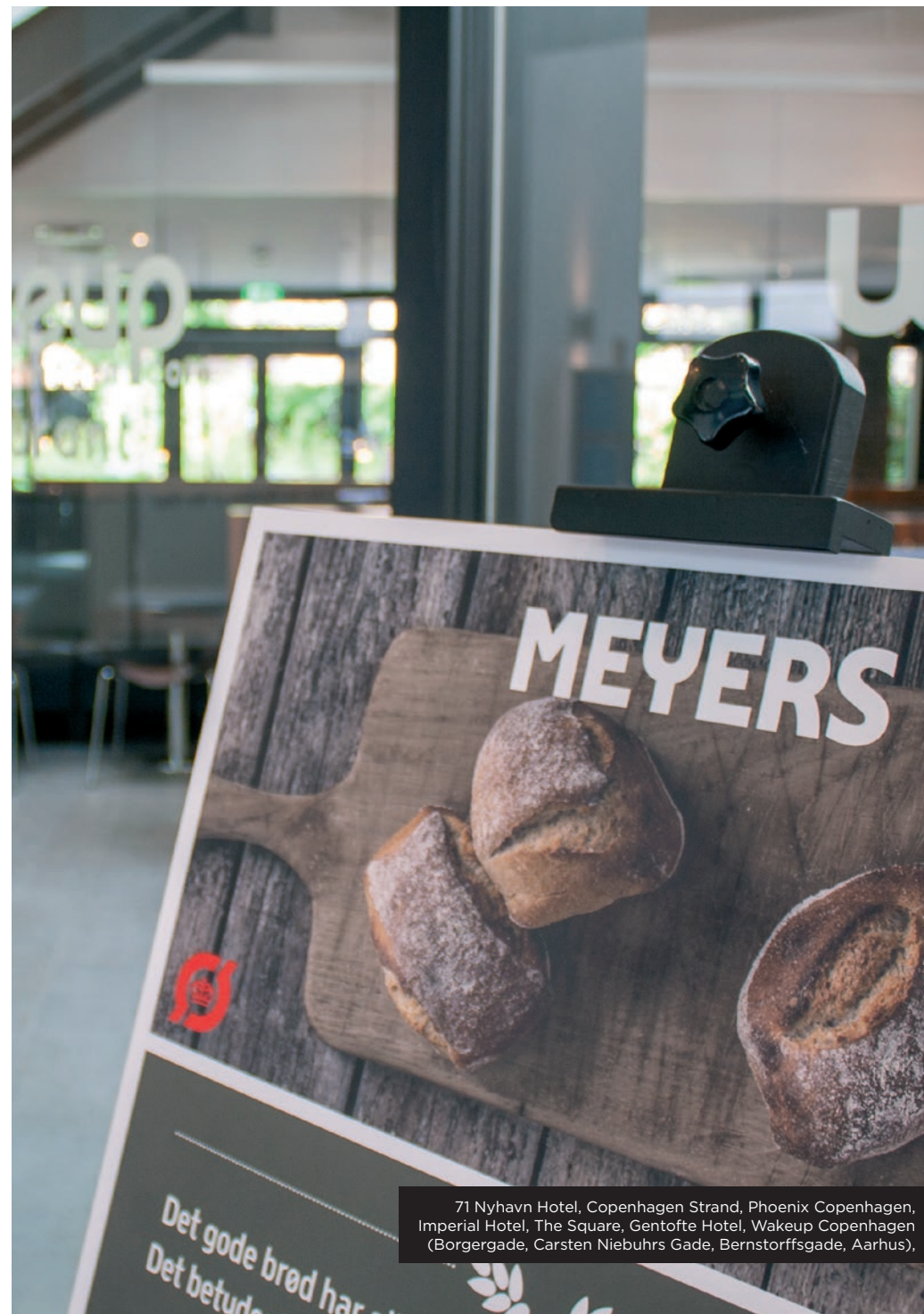
71 Nyhavn Hotel, Copenhagen Strand, Phoenix Copenhagen, Imperial Hotel, The Square, Gentofte Hotel, Wakeup Copenhagen (Borgergade, Carsten Niebuhrs Gade, Bernstorffsgade, Aarhus),

I den kommende tid vil vi derudover - på vores to resterende hoteller - arbejde målrettet på at bringe økologiprocenten op over 30 %, således at vi ved udgangen af 2025 kan sige, at ALLE vores hoteller er certificerede med minimum Det Økologiske Spisemærke i bronze.