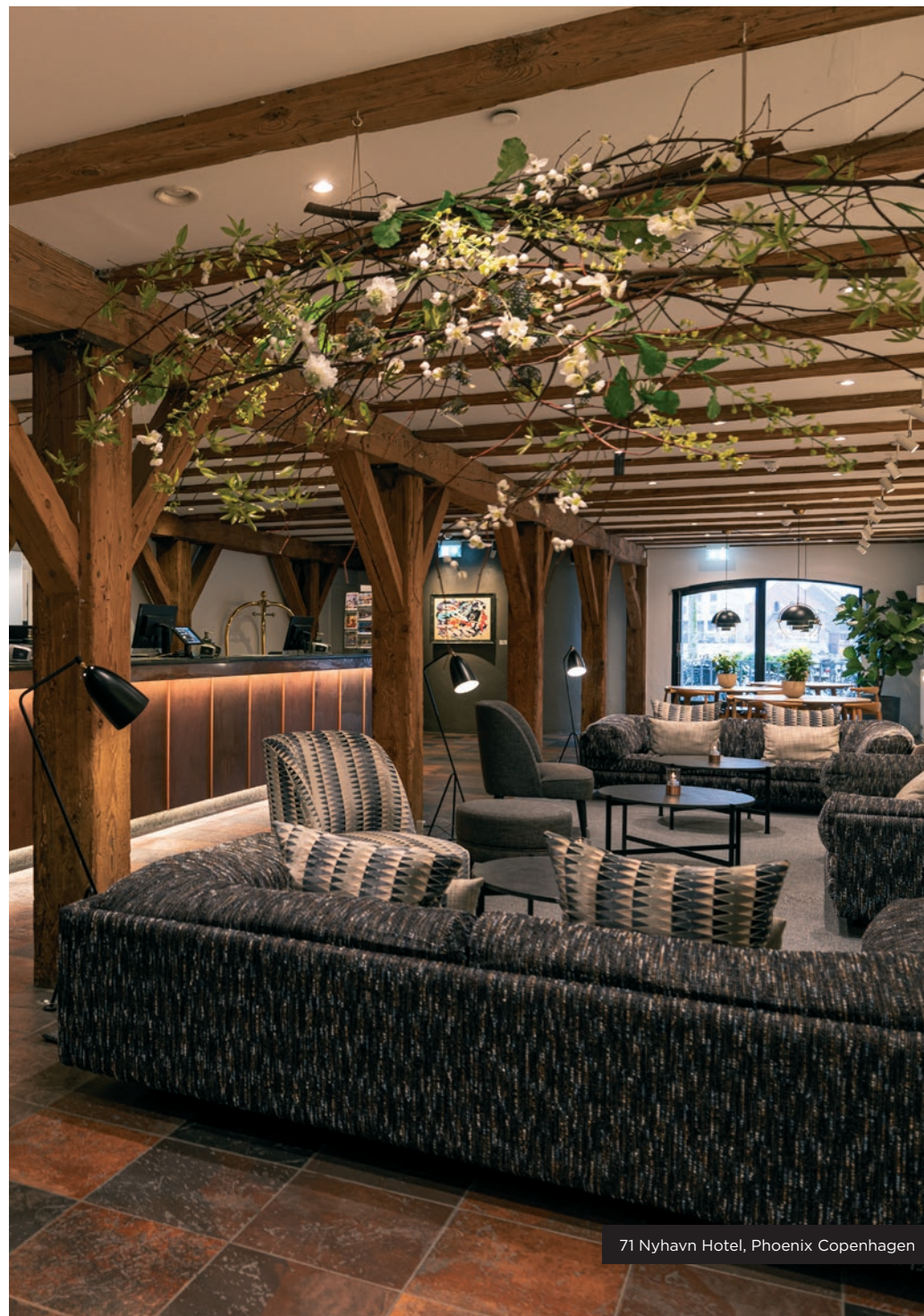
71 Nyhavn Hotel, Phoenix Copenhagen

Inden for de sidste få år har et af Københavns mest historierige hoteller - vores eget luksushotel Phoenix Copenhagen i Bredgade - fået et ansigtsløft over to omgange. Først i 2018 med en omfattende opgradering af alle hotellets suite, udført med respekt for bygningens historie, der daterer sig helt tilbage til 1680'erne. Og senest i foråret 2024, hvor badeværelser og kølesystemer blev ført ind i det 21. århundrede med vandbesparende opgraderinger (f.eks. fra badekar til brusenicher) samt installation af centralt placerede, ressourcebesparende aircondition-enheder.