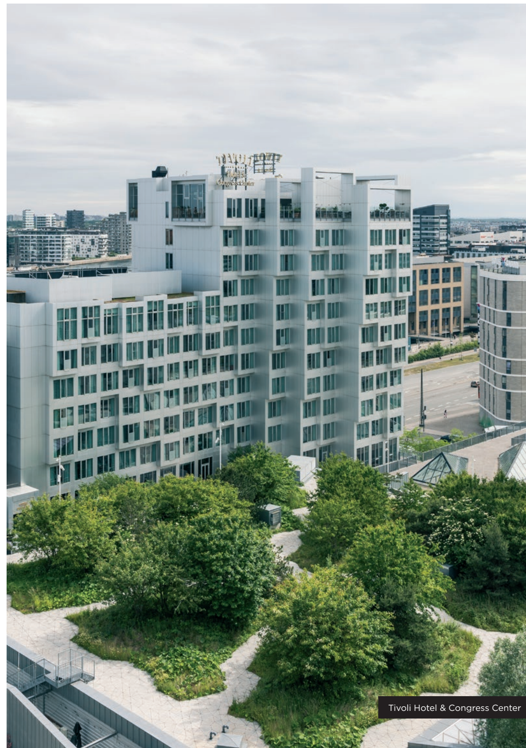
Tivoli Hotel & Congress Center

Grønne byrum som dette skaber små oaser, der opsamler regnvand, øger biodiversitet, rensrer luft og giver rekreation og muliggør dyrkning af træer, blomster og grøntsager. Strøget er åbent for både hotellets gæster, borgere og besøgende i alle aldre.