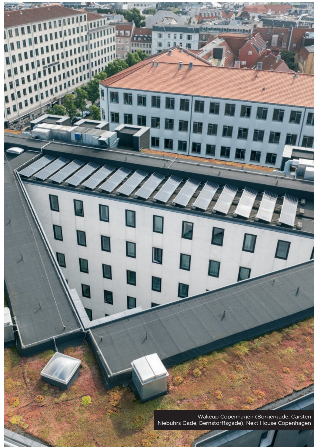
Wakeup Copenhagen (Borgergade, Carsten Niebuhrs Gade, Bernstorffsgade), Next House Copenhagen

Wakeup Copenhagen i Borgergade (billede), Wakeup Copenhagen i Bernstorffsgade og Next House Copenhagen har således alle tre solcelleanlæg installeret på taget af deres bygninger. Anlæggene har tilsammen har en årlig minimumskapacitet på 376.000 kWh. Det svarer til det årlige strømforbrug for cirka 75 danske gennemsnitshusstande.